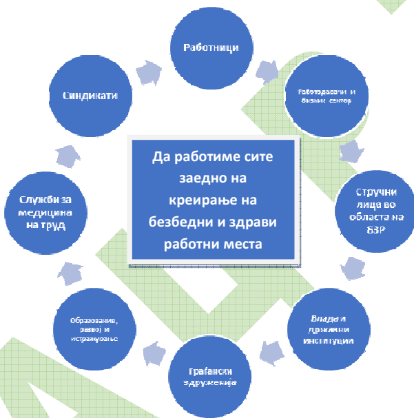
Сл.2.2 „Секој има своја улога!“

Секој од клучните партнери има своја улога и одговорност во реализација на активностите насочени кон спроведување на стратешките цели. Сепак, Стратегијата е заедничка обврска, што значи заедничка посветеност на целите и приоритетите на ниво на претпријатие, сектор или дејност, заедница, како и во целото општество (слика 2.2).