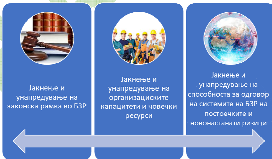
Сл.4.1 Стратешки приоритети за делување